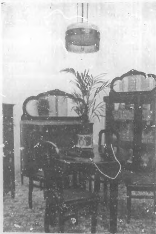
Uno de los elegantes juegos de comedor que esta casa tiene en existencia.

DE PICOS Y CA. NEPTUNO NUMERO 235-B. TELEFONO U-1360.