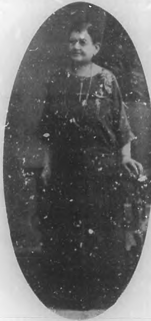
Otra de las más recientes fotografías de la insigne poetisa.

¡Sus últimos versos! ¡Los últimos arpeggios de su