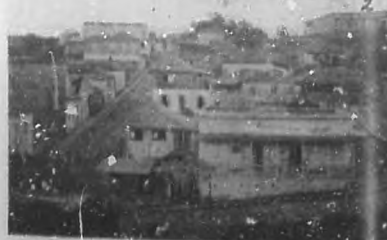
1. Casa solariega de Lola R. de Tío en San Germán (Puerto Rico). 2. Antiguo cuartel español donde actualmente se ha inaugurado la Escuela que lleva el nombre de Lola Rodríguez de Tío.