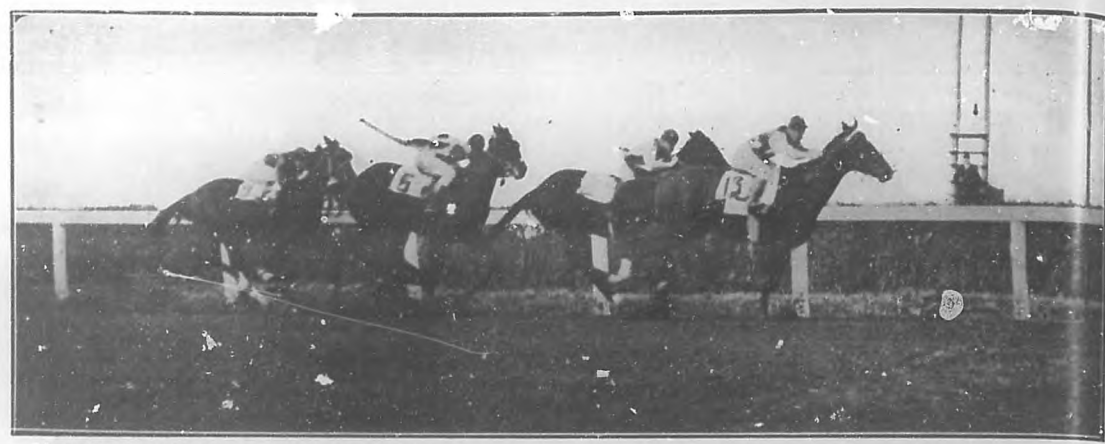
Llegando a la meta en un apretado final en la primera carrera de una tarde hípica en "Belmont Park". El mundo elegante neoyorquino, que es el mundo del "turf", vió en esta ocasión llegar a "O tal" al "wire" de la meta antes que el resto del racimo por el margen apretado de un par de narices.

600 EJEMPLARES EQUINOS DE LAS MEJORES CUADRAS SE ALOJAN EN "ORIENTAL PARK". — EL SÁBADO 29 SE ABRIRAN LAS PUERTAS DEL HIPODROMO PARA DAR PASO AL MUNDO ELEGANTE Y A TODOS LOS FANATICOS DEL TURF