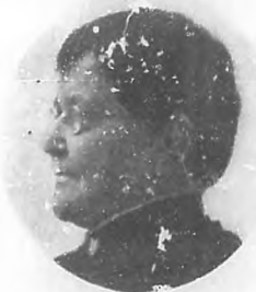
LOLA RODRIGUEZ DE TIO

reinos más armónicos; su ingenio prodigioso produjo las páginas más bellas que registrarse puen en la lírica moderna; y sus poesías, en alas de la