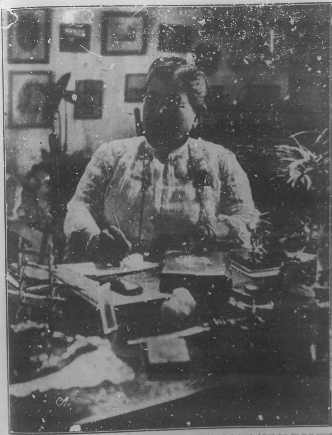
LA MUERTE DE UNA POETISA INSIGNE.—Lola Rodríguez de Tío, la dulce y admirada poetisa borinqueña, fallecida poco días, en su gabinete de trabajo.

Redacción, Administración y Talleres: Edificio de BOHEMIA, América Latina, número 20, 21 y 22. Teléfono: 127-0000, M-1222; Alameda Central, A-3558.