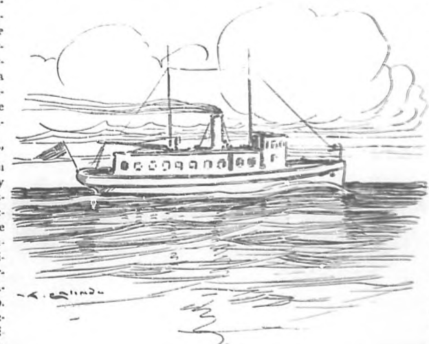
"GEORGE W. CHILDS" Vaporcito norteamericano, comprado por la delegación cubana en New York, para enviar a Cuba una expedición.