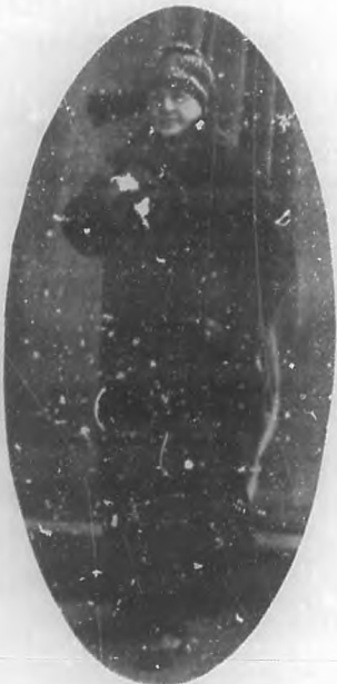
Una de las últimas fotografías de Lola Rodríguez de Tío.

su patria amada, su cariñosa Borinquén, que hoy debe florarla como cuando se flora con el alba. Muy joven tuvo que abandonar a su patria obligada por su constante labor en pro de la libertad de su país. Viajó por distintos pueblos de América y de Europa y entonces fué cuando vino a Cuba. Aquí plantó su tienda, aquí halló asilo su musa errante, aquí formó su nido. Y el divino ruseñor cantón en esta tierra de bendición sus