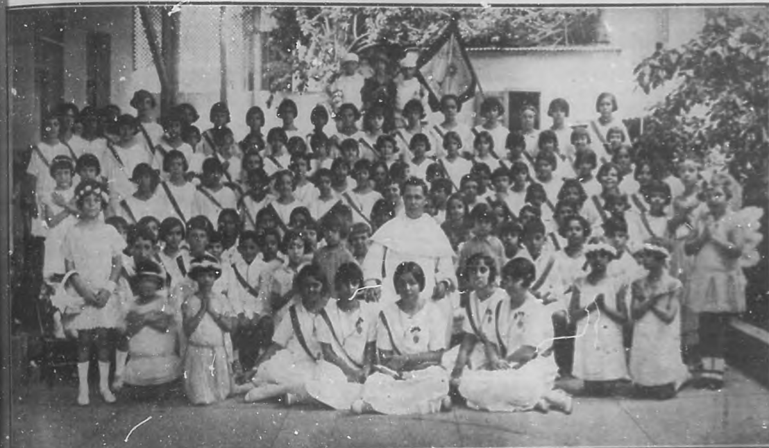
HERMOSO ACTO RELIGIOSO.—Niñas que forman la institución denominada "Pajes del Colegio Nuestra Sra. de las Mercedes", que días pasados celebró un hermoso acto religioso.

hacer de la perfecta organización y eficaz actuación la Junta de Protestas y esas aabanzas no pueden ser más justas.